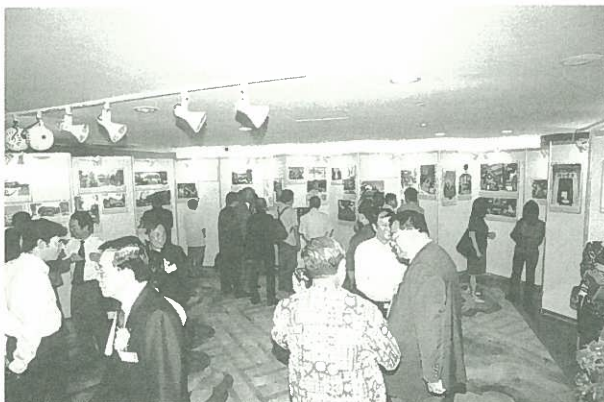
《道風百年》發行典禮附設之展覽活動。

本書剛獲評選為「名家推介」四十本香港書展2002參展商出版新書之一，書評撰寫人梁文道先生認為本書「可說香港道教的大百科」，充分肯定此書的參考價值。