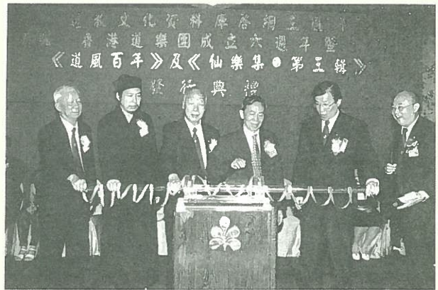
主禮嘉賓們主持《道風百年》發行儀式。